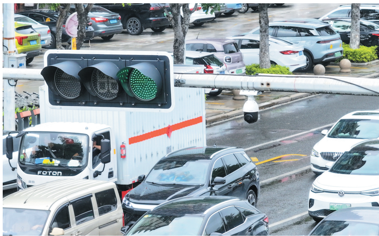
柳城大桥北灯控路口，一处安装在红绿灯旁的 AI 侦测探头。