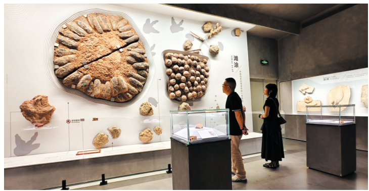
世界上最大的一组植食(右)和肉食(左)恐龙蛋窝,令游客驻足观赏。

记者了解到,本次“石”光隧道探秘寻宝之旅将持续至19日,游客朋友可通过关注“福建省英良石材自然历史博物馆”公众号或各新媒体平台,了解相关活动信息,带上身份证或登录官方小程序实名登记购票。公益讲解时间为上午10时和下午3时,请提前在游客中心集合。