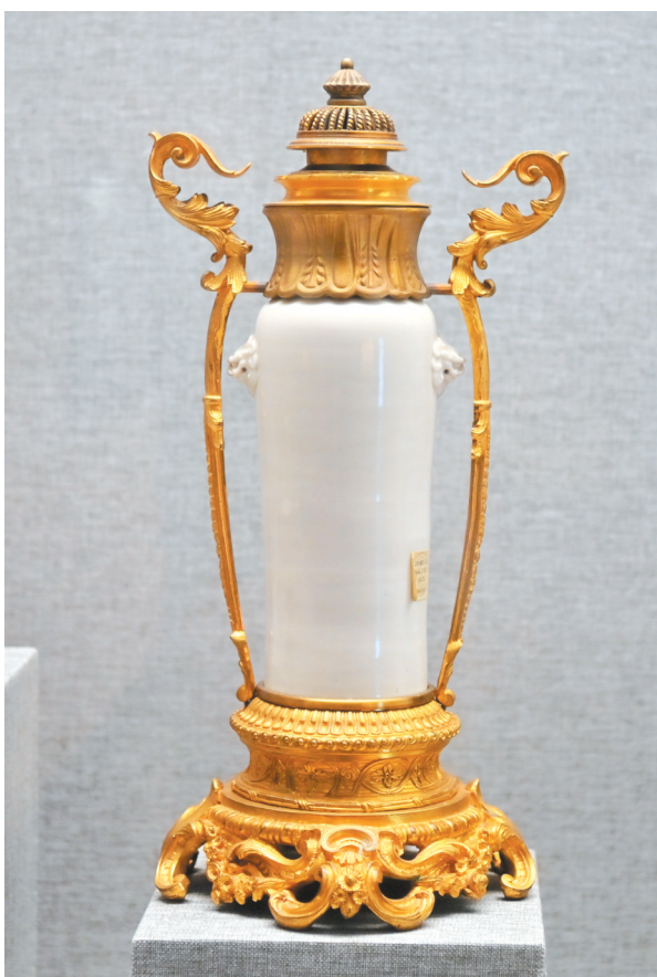
▲明代德化窑白釉狮耳瓶

瓷器还能这么豪华!”现场,前来观展的学子们穿梭展柜之间,近距离观赏每一件回流珍品,看着素白瓷身华丽“变身”,连连惊叹道。