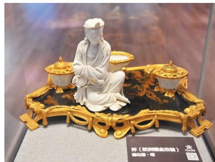
▲明代德化窑杯(欧洲鎏金改装)