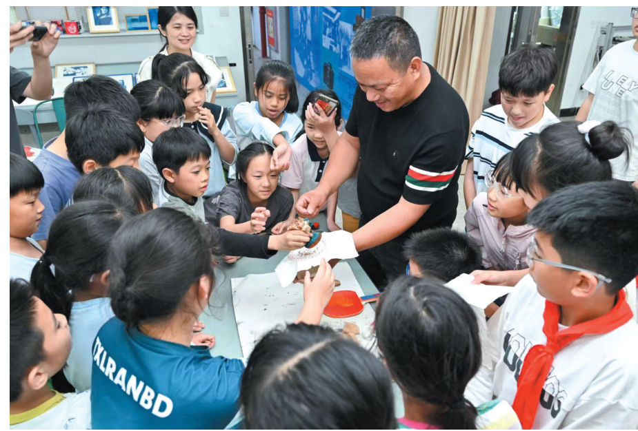
教师指导学生拓印闽南传统建筑瓦当。