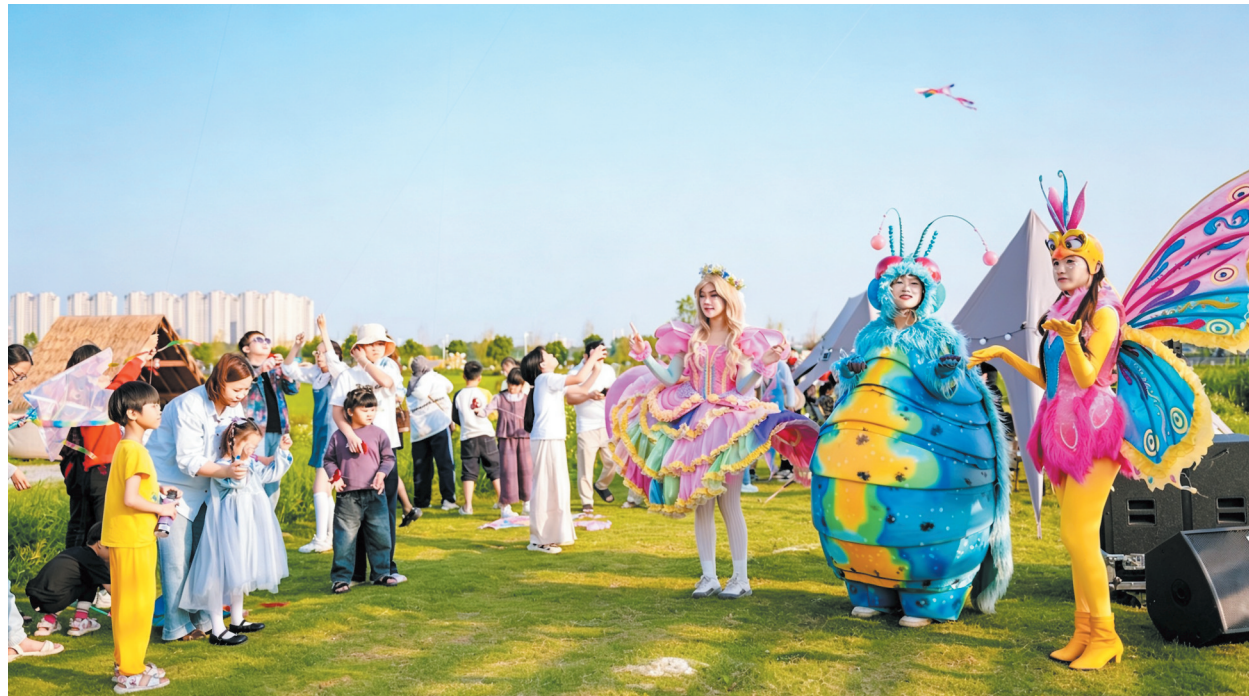
水头大盈溪举办“五一”踏青撒欢派对

热度的背后,是扎实的内容支撑。依托世界遗产九日山祈风石刻,南安完整复刻南宋泉州知州真德秀主祭的祈风仪式,再现宋元海上丝路祈风盛景,开设祈福宴劳动者专场,以古韵礼仪致敬坚守岗位劳动者。国风主题露营地、万福同饮公益奉茶专区人气满满,饮福精酿、饮福杯、靠山靠枕等系列文创好物首次亮相,联动南安文庙举办《来南安,见闽南》新书首发式。九日山景区假期接待游客超4万人次,全网曝光量超250万次,登上央视中文国际频道《中国新闻》、