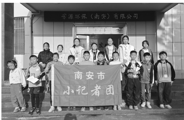
新联小学小记者合影