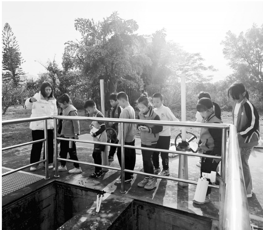
厌氧池干净了不少,没有漂浮的土黄色杂物,池中的液体呈黄褐色——经过厌氧池预处理的污水,正在这里进行进一步净化。

氧化沟里的微生物能分解污水中的有机污染物。工作人员通过不断曝气,让混合液始终处于悬浮状态,这样能保证微生物和污水充分接触,从而让净化效果更好。