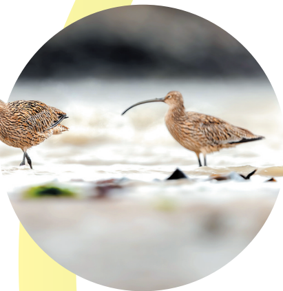
大杓鹬正伫立于浅水滩涂之上,最引人注目的是那根细长而优雅下弯的喙,宛如天然的探针,正专注地探入泥沙中搜寻食物。