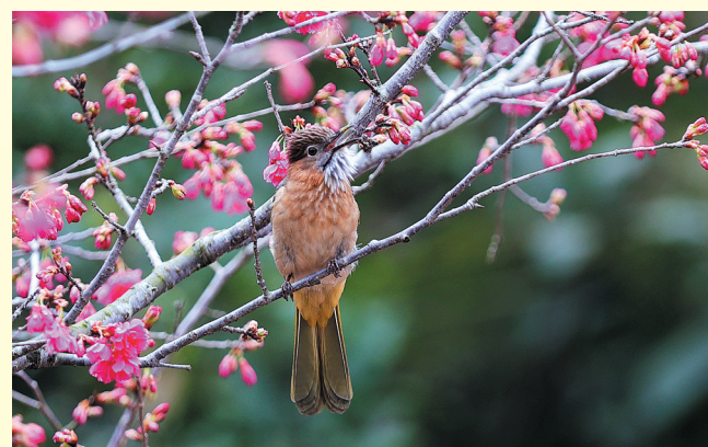
一只绿翅短脚鹬正栖息在盛开的樱花枝头,它正啄食花苞或嫩芽,姿态灵动,与粉红的樱花形成鲜明对比。