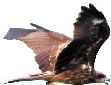
一只正在飞行的黑鸢。这种鸟栖于开阔平原、草地、荒原及低山丘陵地带,常单独或小群在高空盘旋觅食,以小型鸟、鼠、蛙、鱼、昆虫等为食。