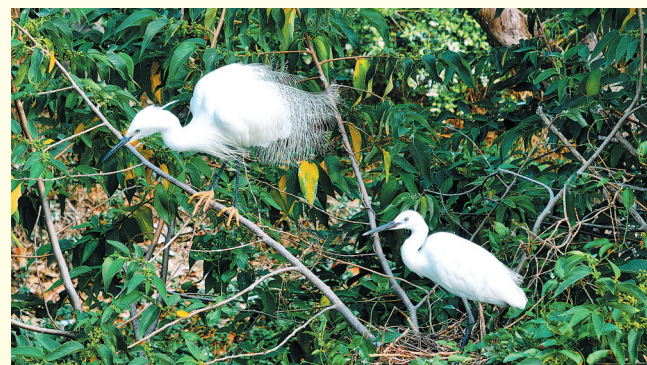
两只白鹭栖息于繁茂枝叶间,仿佛在守护着这片绿意盎然的家园。