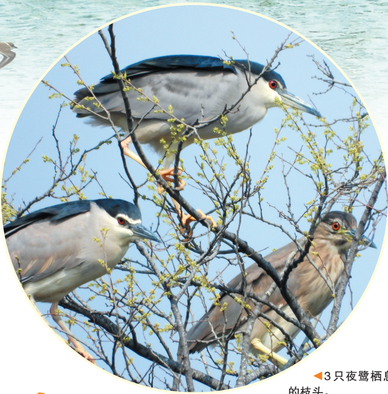
3只夜鹭栖息于春天的枝头。