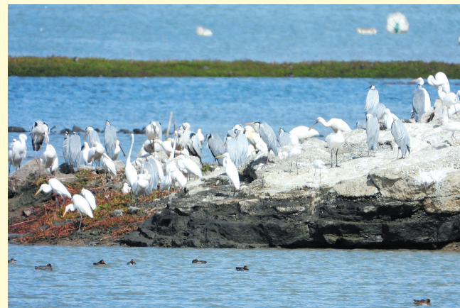
大白鹭栖息于水边岩石之上,它们或低头理羽,或凝神远望,如诗如画。