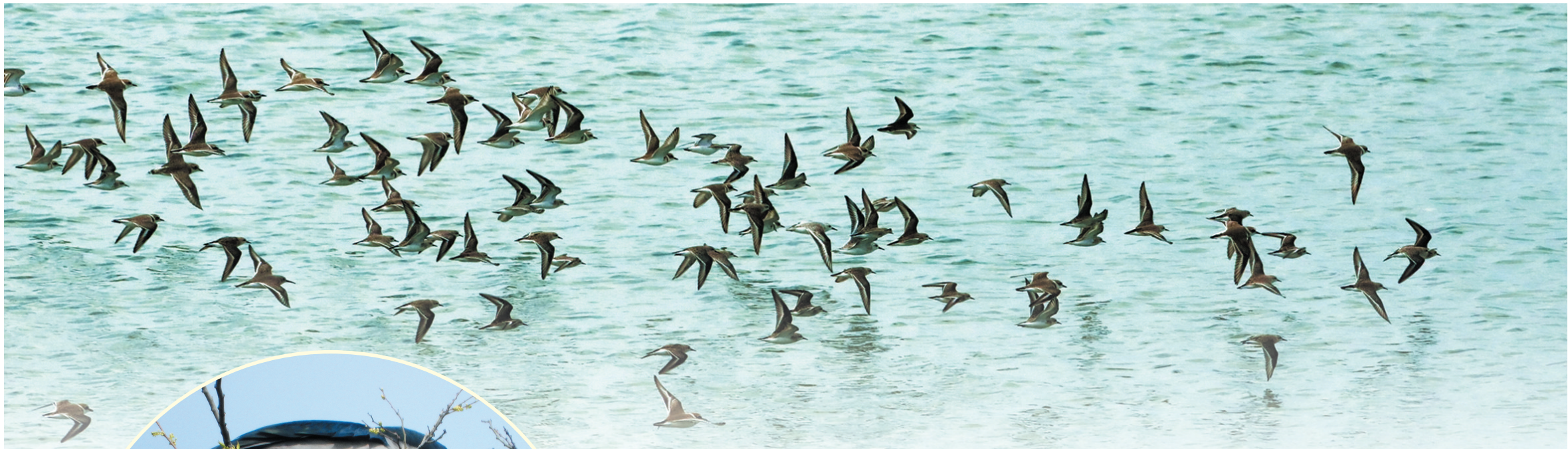
一群在水面上低飞的鸟儿,姿态轻盈且协调,仿佛在进行一场无声的集体舞蹈。(吴柯朝摄于水头镇)