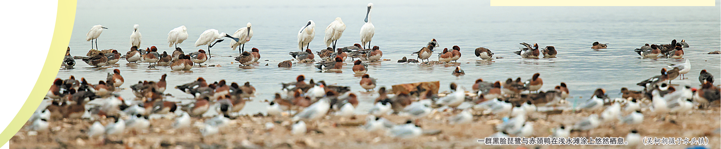
一群黑脸琵鹭与赤颈鸭在浅水滩涂上悠然栖息。(吴柯朝摄于水头镇)