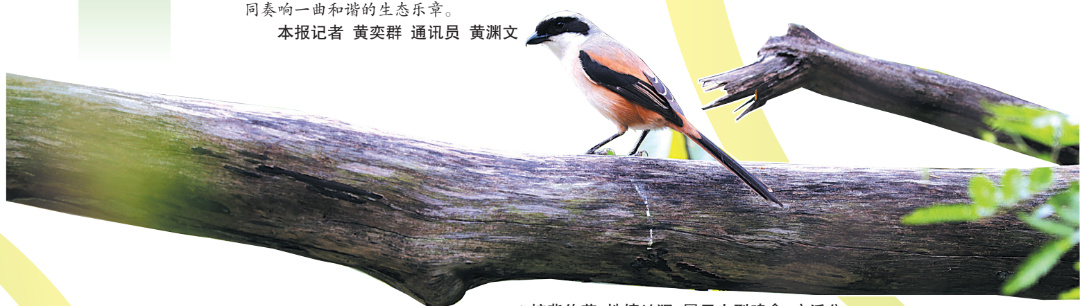
棕背伯劳,性情凶猛,属于小型鸣禽,广泛分布于我国黄河流域以南,在林缘、农田、灌丛区域,都能见到它们。