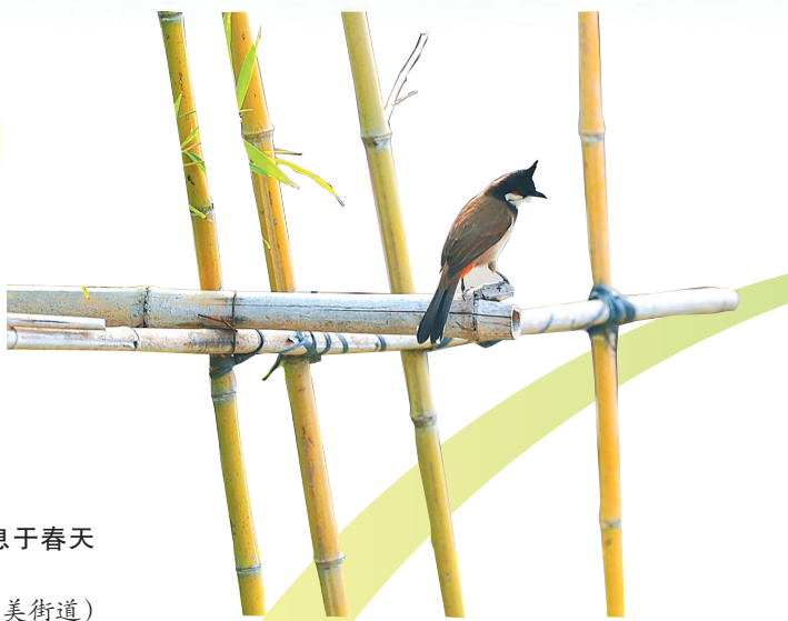
红耳鹎是南方常见的林鸟,性情活泼,鸣声清亮,常在树层跳跃觅食。它们不畏人,常出现在公园、庭院。