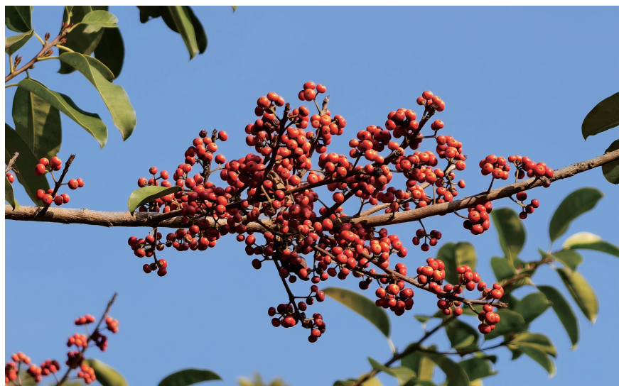
这个季节,也有果实来与鲜花斗艳。看!这是冬青。(摄于美林街道观音山)