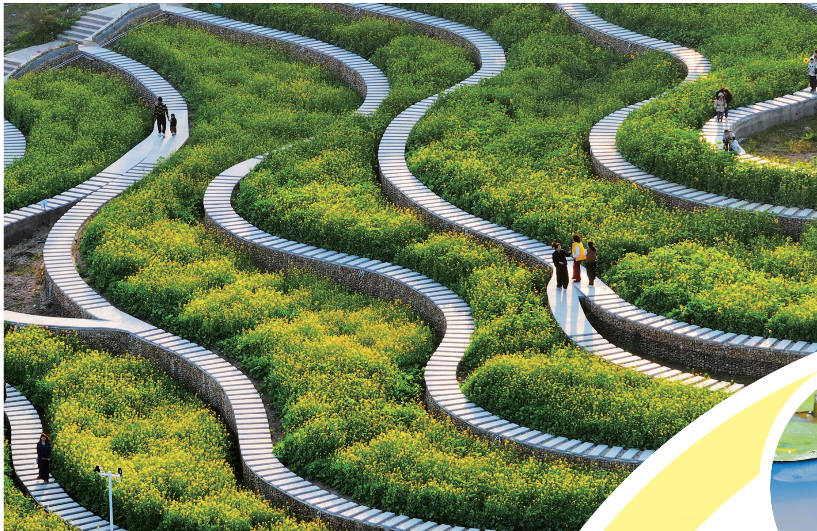
四季不同景的龙峰广场,在春天迎来了多种油菜花的盛开。