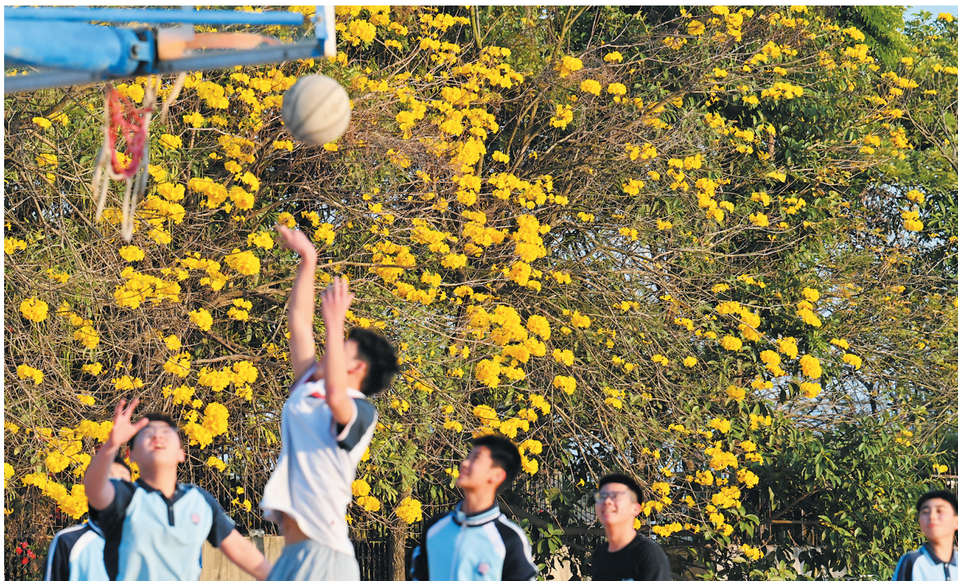
▼黄花风铃木前,一场篮球赛激战正酣。(摄于南安一中江北校区)