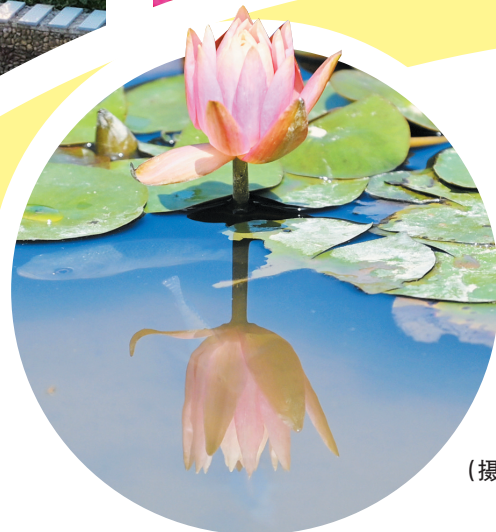
鱼戏莲叶间,睡莲悄然绽放。 (摄于城西湿地公园)