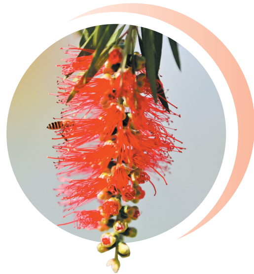
▲美花红千层长着一把奇特的“刷子”。(摄于霞美江滨南路)

当然,春花的盛宴远不止于此。高大的木棉捧出火炬般热烈的红花,傲立晴空;幽雅的茶花静吐芬芳,花叶同香;更有那形如瓶刷、毛茸茸的美花红千层,在枝头摇曳出几分俏皮。而春的常客——油菜花,也将大地铺成金黄的绒毯……它们和踏春的你们,一起将南安点缀得如诗如画。