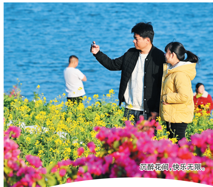
沉醉花间,快乐无限。