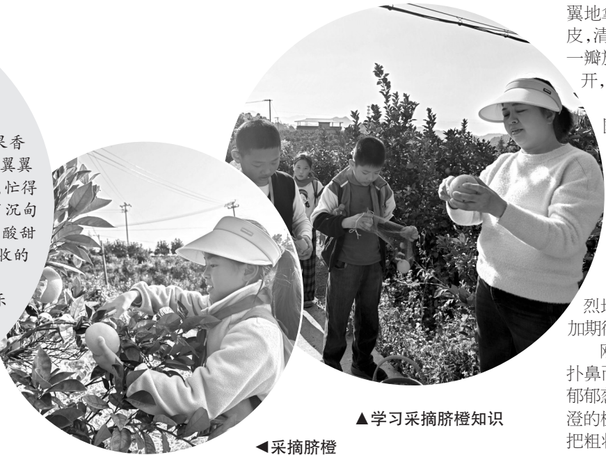
▲学习采摘脐橙知识