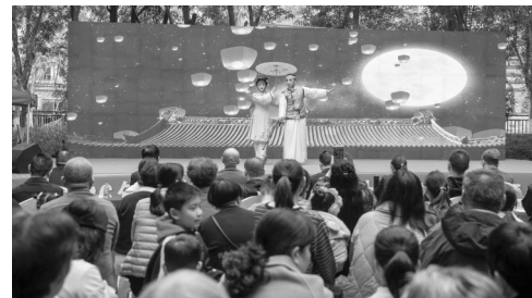
文艺会演轮番上演,将优质文化盛宴送到群众家门口。

本报讯(记者 王丽清 通讯员 陈晓龙 吴昕玮 文/图)5日,2026年南安市文化科技卫生“三下乡”集中服务活动在柳城街道四季家园小区热闹开幕。一场集文艺演出、便民服务、知识普及于一体的惠民盛宴,让群众在家门口收获了满满的温暖与实惠。