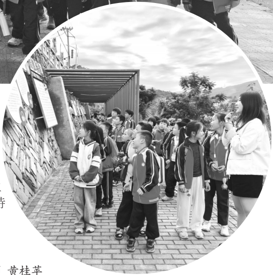
▲走进“音乐水乡”诗南村

紧接着,我们步入一座用鹅卵石精心砌成的古老私塾。踏入其中一间屋子,讲解员借助一张张泛黄的老照片和一份份翔实的资料,为我们讲述了诗南村的发展历程