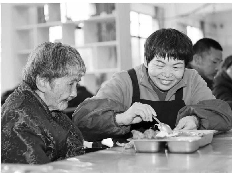
志愿者们细心地为老人准备饭菜。

当天上午,20多位志愿者带着新鲜的食材来到了金淘镇敬老院。后厨内,烟火气腾腾,切菜、炖煮、分餐……大家分工明确、协作默契,为老人们精心烹制了一顿丰盛的午餐。红烧肉、卤鸡腿、白灼虾、猪筋烩海参……餐桌上,软糯的米饭搭