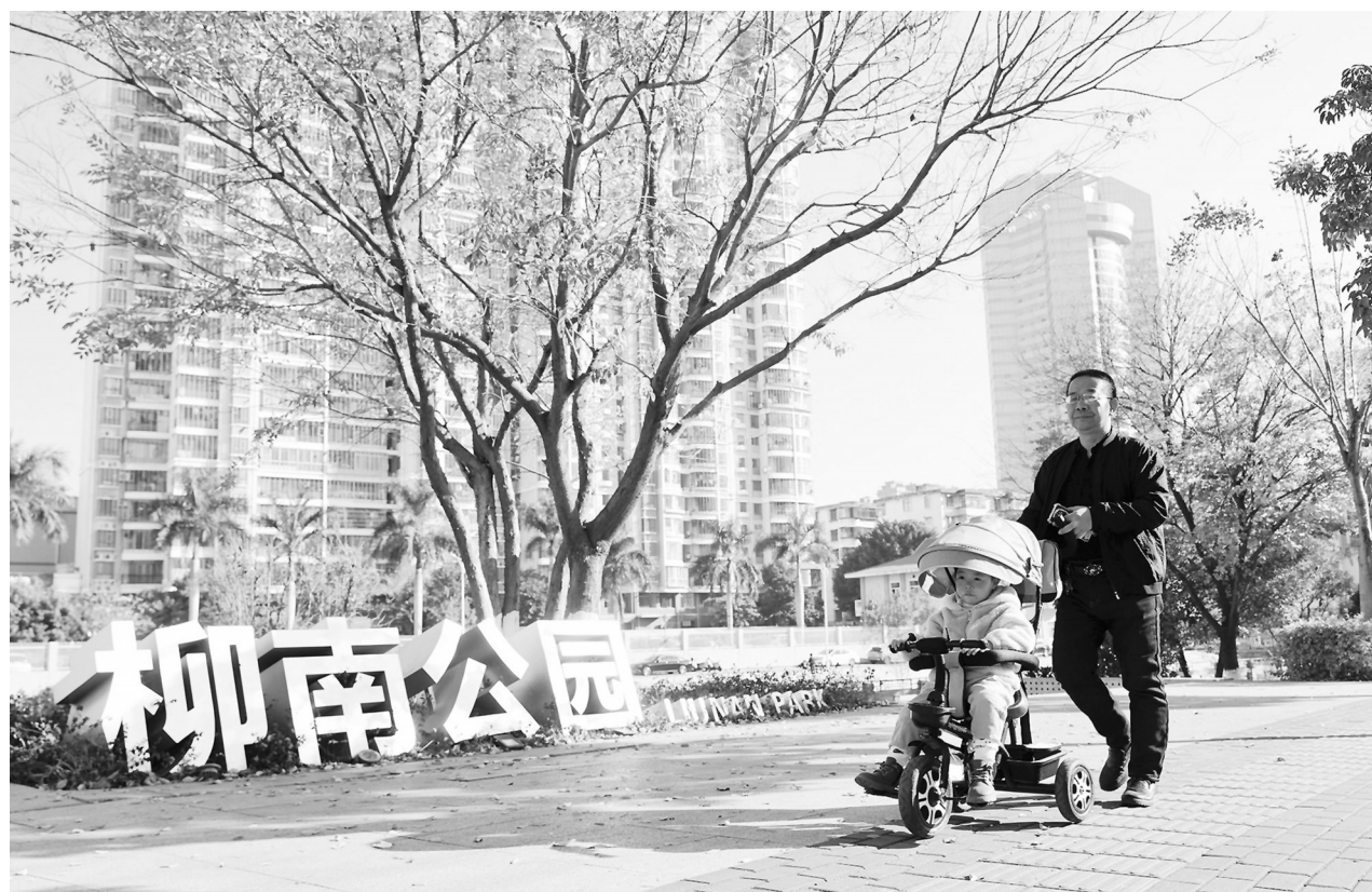
在柳中街道柳南公园,市民带着孩子在公园里散步。

精致的“口袋公园”离不开统筹布局与精细管养。南安围绕“300米见绿、500米见园”目标,靠前调研闲置地、废弃地等低效用地,多部门联动破解产权、管线等难题,推动成功街等老