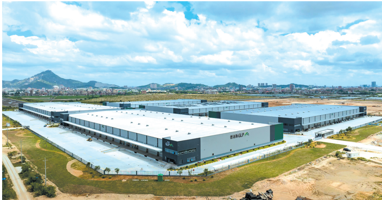
位于石井镇的普洛南安空港物流园开始投入使用

位于霞美镇的泉州(南安)高端装备制造产业园,由宁夏共享集团参与投资建设的全球罕见万吨级铸造3D打印全流程智能工厂——国家智能铸造产业创新(泉州)中心已正式投入运营。该中心借助3D打印技术,可实现铸件最快7—14天即可完成交付,不仅成功攻克复杂构件的制造难题,更创新打造