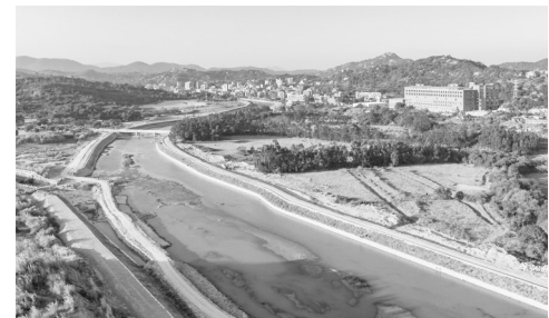
官桥彭溪河道治理已取得显著成效。

本报讯(记者 庄树鸿 通讯员 林亚惠 杨玉霜 文/图) 挖掘机的巨臂在河道中挥动,工人们忙着砌筑生态护坡……近日,南安市官桥镇九十九溪彭溪段河道治理工程现场,记者看到项目建设正加速推进。这项全长超6.5公里的民生工程,自2023年11月启动以来已取得显著成效,预计本月全面竣工。