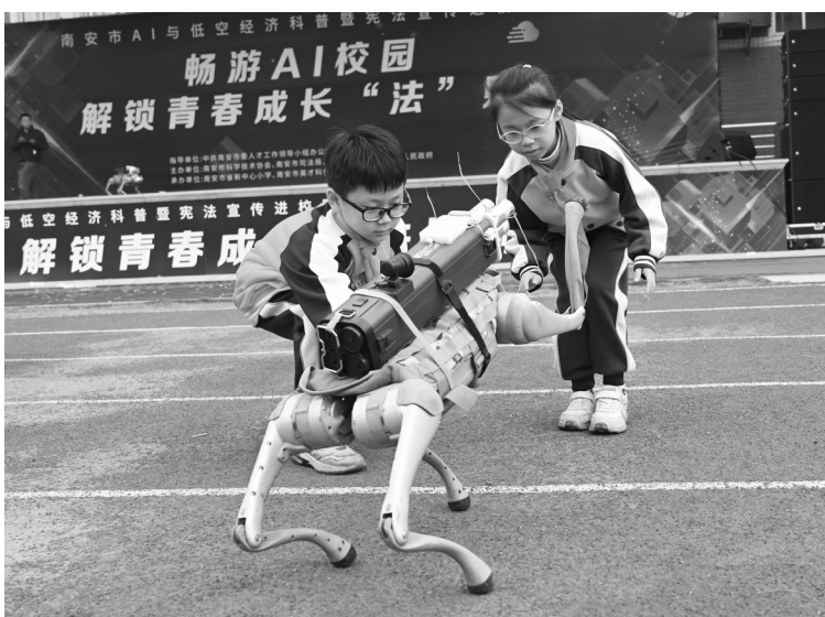
智能机器狗与孩子们互动。

活动现场气氛活跃,互动频频。操场上,几只智能机器狗一亮相便成为全场焦点,它们不仅灵活完成绕场、蹲坐、行礼等动作,还能与孩子“握手”。紧随其后的模拟应急救援演示将现场气氛推向高潮——挂载水枪的救援无人机在操作员的指挥下迅速升空,稳定悬停后对准模拟火点实施精准喷射灭火,清晰展示了低空科技在抢险救援中的实战能力。此外,“氮气飞球”“火焰掌”等科学实验,巧妙地将物理化学原理转化为视觉奇观,引得孩子们惊呼连连。