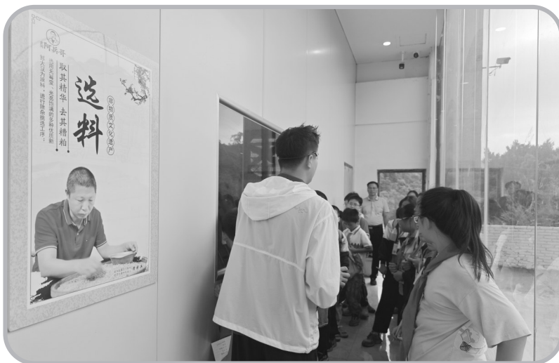
参观豆干制作流程

盐露豆干作为我家乡的特色美食,以其独特的咸香味深受人们喜爱,这是老一辈传承下来的宝贵技艺。作为小记者,我更希望用手中的笔和镜头,将盐露豆干的故事传播出去,让更多人了解这令人赞不绝口的美食。