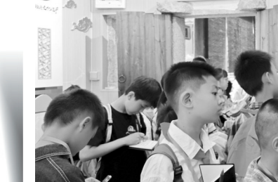
学习熟地相关知识