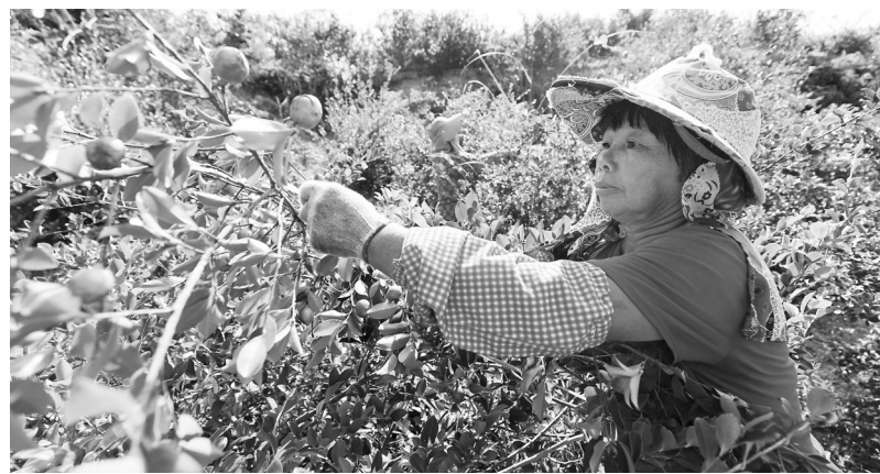
工人们正在采摘油茶果。

霜降前后是油茶采摘的黄金季节。眼下,南安市东田镇6000多亩油茶陆续成熟。村民们开始忙着采收成熟的油茶籽,确保丰收的油茶“硕果归仓”。 走进东田镇岐山村近1000亩的油茶林,放眼望去,漫山遍野的古茶树郁郁葱葱,随着山势蜿蜒伸展,一颗颗饱满的油茶果挂满枝头。油茶林里人头攒动,工人们头戴草帽,手提竹篓、桶等工具,穿梭在油茶林里,忙着采摘、装袋、搬运,处处洋溢着丰收的喜悦。 “今年的油茶大丰收,我们每一天都有20多名工人上山采摘,一天能摘两三千斤油茶籽。”南安市非凡农场负责人周水办告诉记者,采好的油茶果要经过三四天的发酵,水分蒸发后进