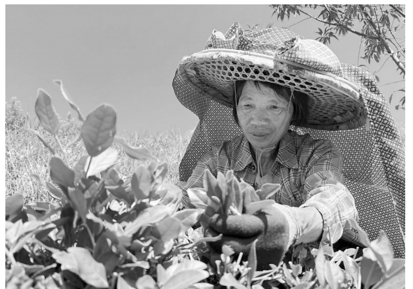
采茶工人正在采收茶叶。

近50名采茶工人抓紧采收茶青,一天可采茶青650公斤;同时,还有14名制茶工人加紧将茶青加工成干茶。