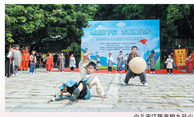
少儿宋江阵亮相九日山。