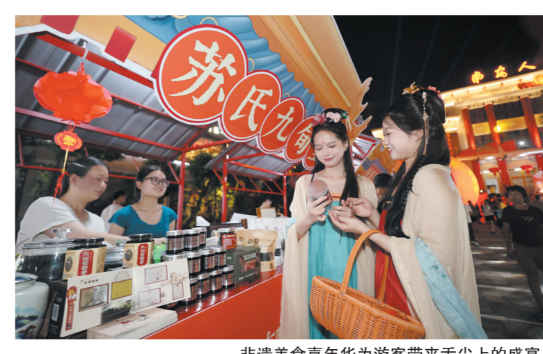
非遗美食嘉年华为游客带来舌尖上的盛宴。