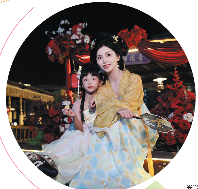
▶“麻花即兴”演出首次走进岑兜村。

2025年的这个“双节”假期,岑兜村用一场高甲戏剧文化周,成功完成了一次从“戏曲发祥地”到“活态戏剧小镇”的蜕变。这场持续10日的文化狂欢,用“处处是舞台”的创意,为中国非遗传承提供了“传统与潮流共生”的生动样本。