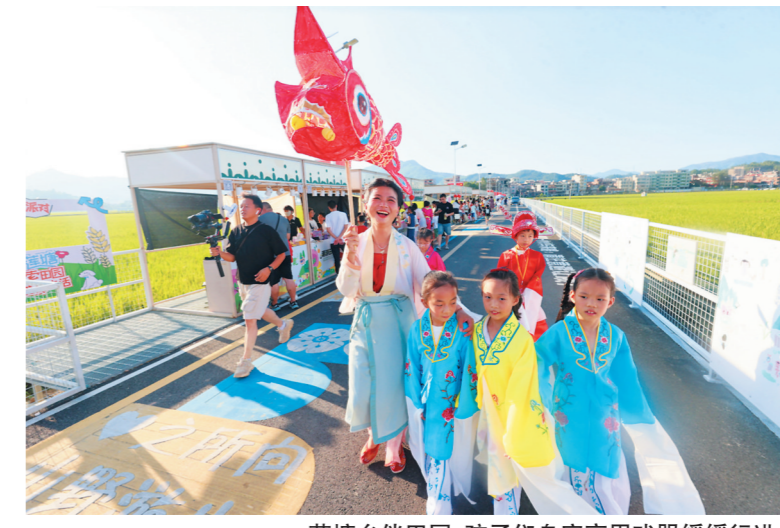
莲塘乡田园,孩子们身穿高甲戏服缓缓行进。

顺着溪流往村里走,九溪村独特的石厝景观更让游客驻足流连。鹅卵石厝,彩色石头厝顺着山势层层叠叠,错落有致地分布在村落各个角落,从厝埕、巷子到村内道路,甚至连水井,都由各式石头精心砌筑而成,整个村落宛如一处露天的彩色石厝“博物馆”,古朴中透着灵动,游客们纷纷举起手机,将这份独特的古朴之美定格在镜头中,也定格在假日的美好记忆中。