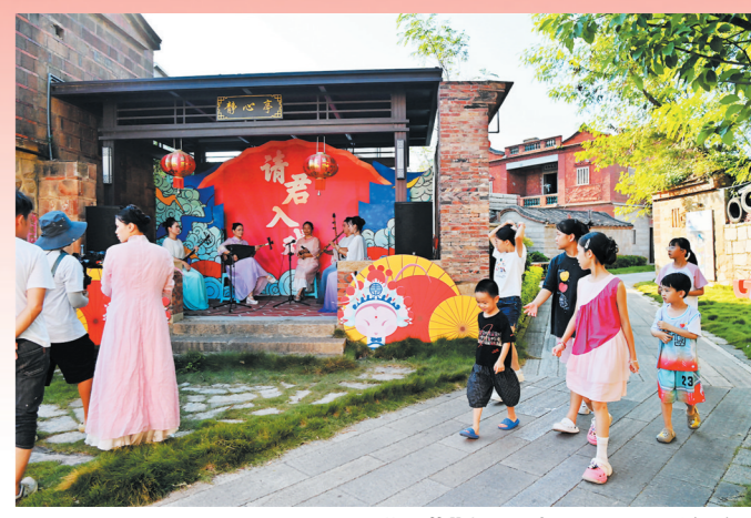
“双节”期间,岑兜村处处是舞台。