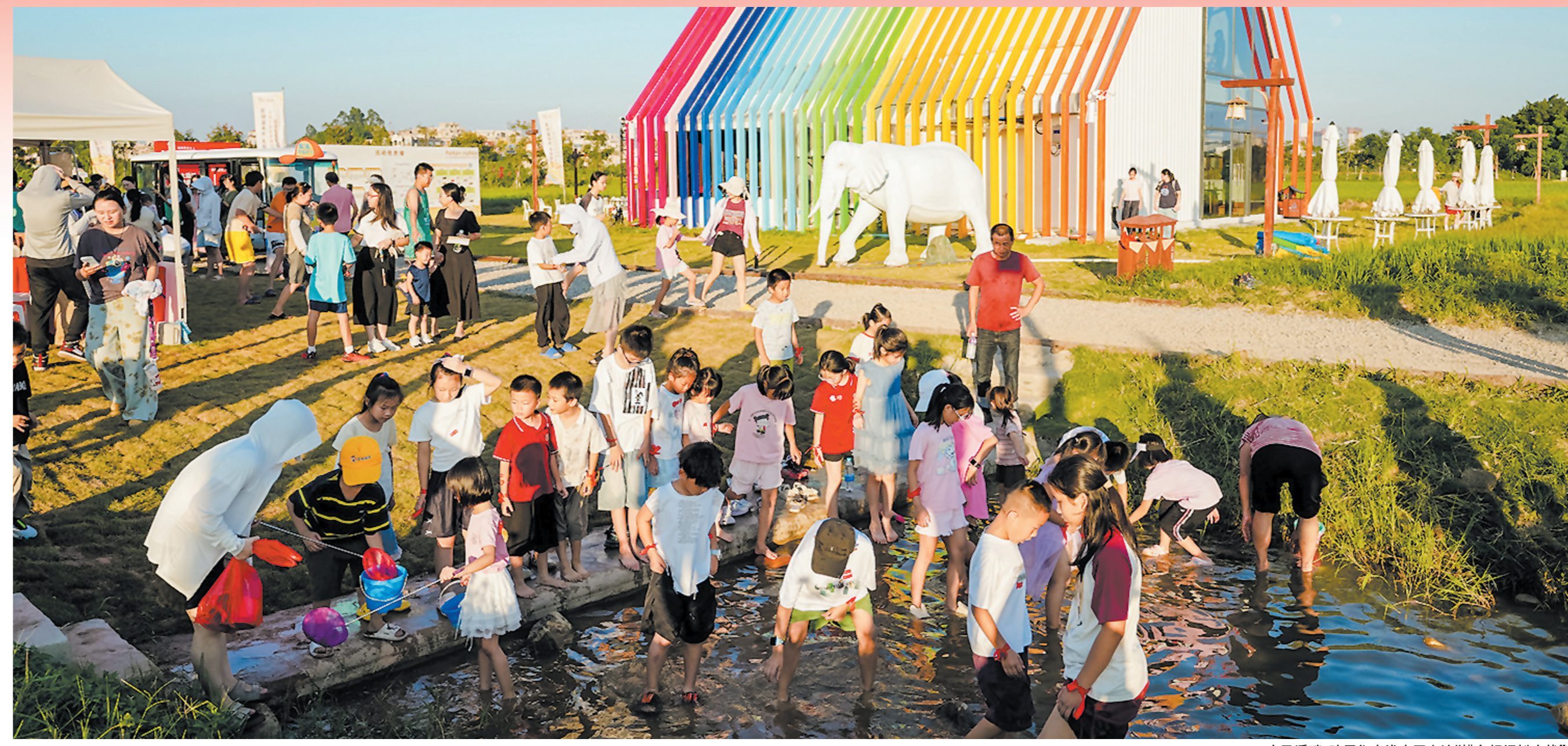
大盈溪畔,孩子们在浅水区上演“摸鱼捉泥鳅大战”。

值得一提的是,除了核心的非遗美食市集外,现场还同步开展了“匠心流芳”非遗美食研学体验、“月满华诞”双节游园会、“光影武荣”月下华彩夜、“五福临门”阖家福活动、“寻味南安”非遗打卡活动等主题环节,从“吃、逛、玩、学、赏”多个维度,将舌尖的味蕾满足与非遗的文化熏陶深度融合,让市民朋友在品味美食之余,沉浸式感受非遗的独特魅力,实现从“味觉享受”到“文化体验”的立体升级。