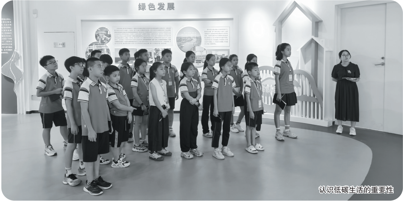
认识低碳生活的重要性