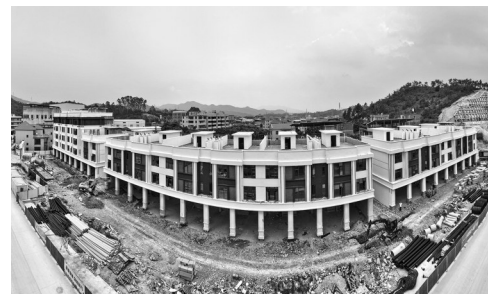
建设中的北部新城水产预制菜产业园配套安置房A地块工程

产业园项目建设进展顺利,离不开政企协同发力,得益于“政府+国企+央企”模式的高效运转。据介绍,为啃下项目建设“硬骨头”,洪梅镇政府牵头成立工作专班,建立保障机制,各成员分工明确,责任到人,及时协调项目建设中遇到的问题,专人对接相关部门手续报批工作。每周定期组织业主、施工、监理、设计等单位召开项目协调推进会,每天至少3次碰头解决问题。