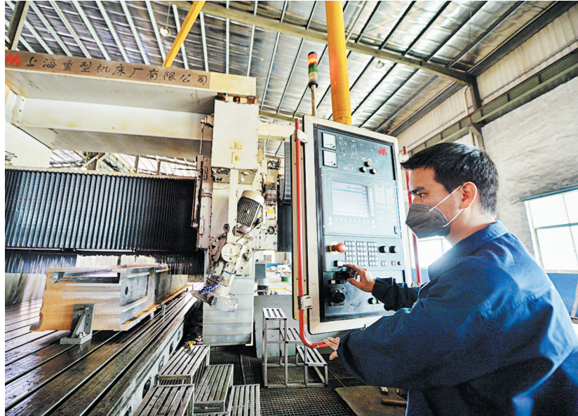
成功机床车间,工作人员正在操作设备。

持续加大研发投入、深化产学研合作,是企业不断突围的关键路径。近年来,胜利阀门已获得多项技术专