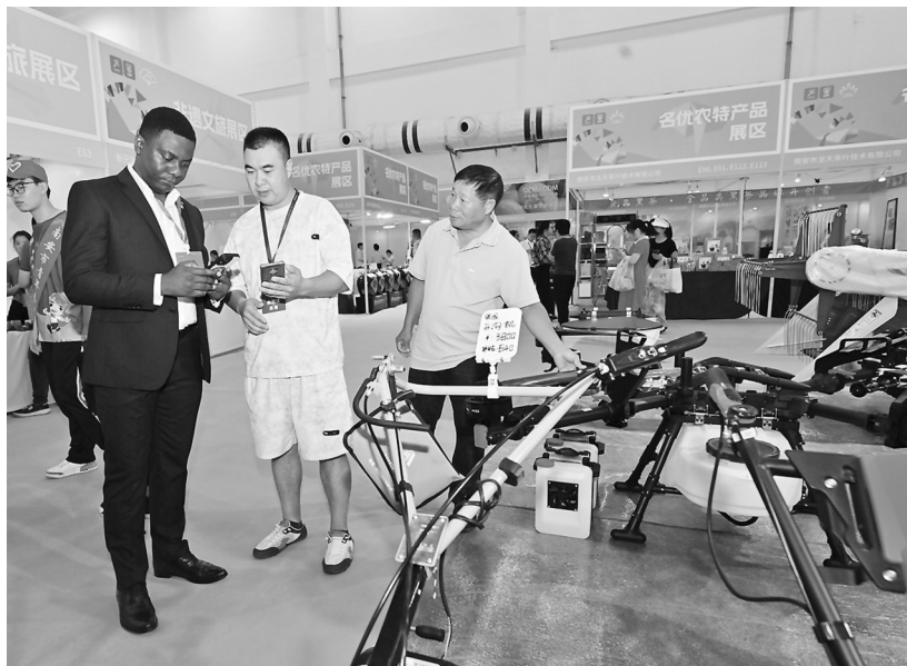
本届农订会邀请8个共建“一带一路”国家的19家企业参展。

现场,展位上各色农产品琳琅满目,让人眼花缭乱。主馆大厅,南安特色高甲戏腔一开,瞬间点燃气氛;美食嘉年华更是贴心开启延时模式,不断刺激食客味蕾;簪花等非遗文旅体验让人忍不住上前尝试。好吃、好看、好玩……摩肩接踵的人群,欢声笑语的场馆内满是腾腾的烟火气。