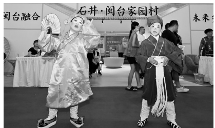
特色高甲戏演出,点燃现场气氛。