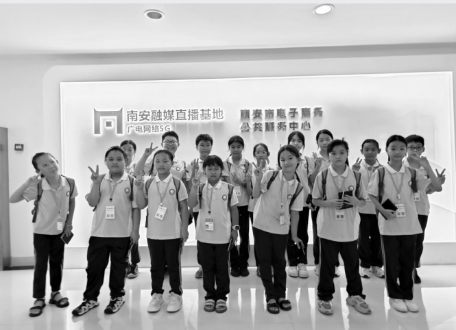
走进李南融媒5G直播基地