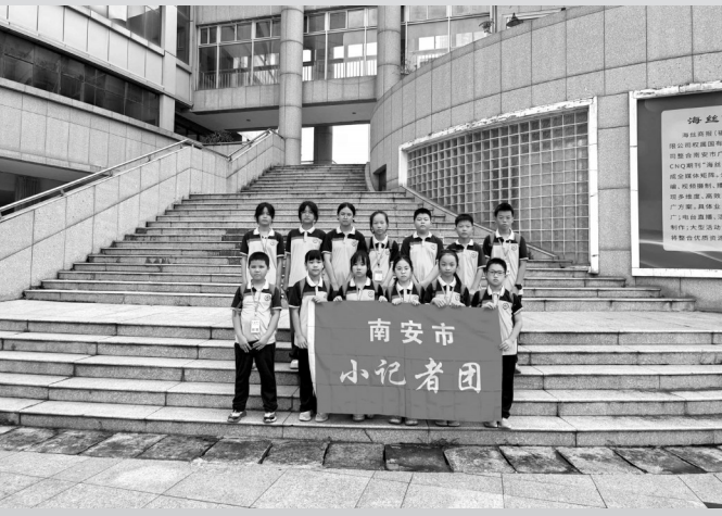
仁溪小学小记者合影