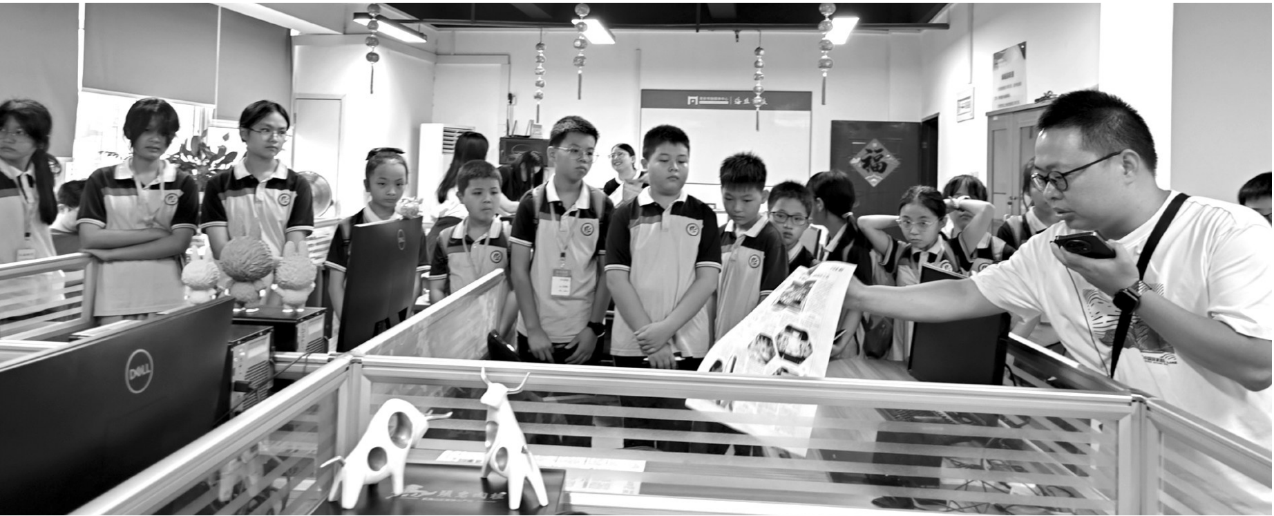
亲历一张报纸的诞生

首先,讲解员带我们来到二楼演播厅,沉浸式观看了《风从海上来》宣传片。灯光缓缓暗下,巨大的屏幕亮了起来。画面中,浩瀚的大海掀起层层浪花,镜头带着我们“飞”越山川河海:渔船在波涛中前行,渔民们脸上洋溢着丰收的喜悦;现代化的港口里,巨大的货轮在碧波中稳稳停靠,机械臂井然有序地装卸货物,集装箱密密麻麻。伴随着激昂的音乐,我深深体会到,这些镜头的背后,是记者们不畏风