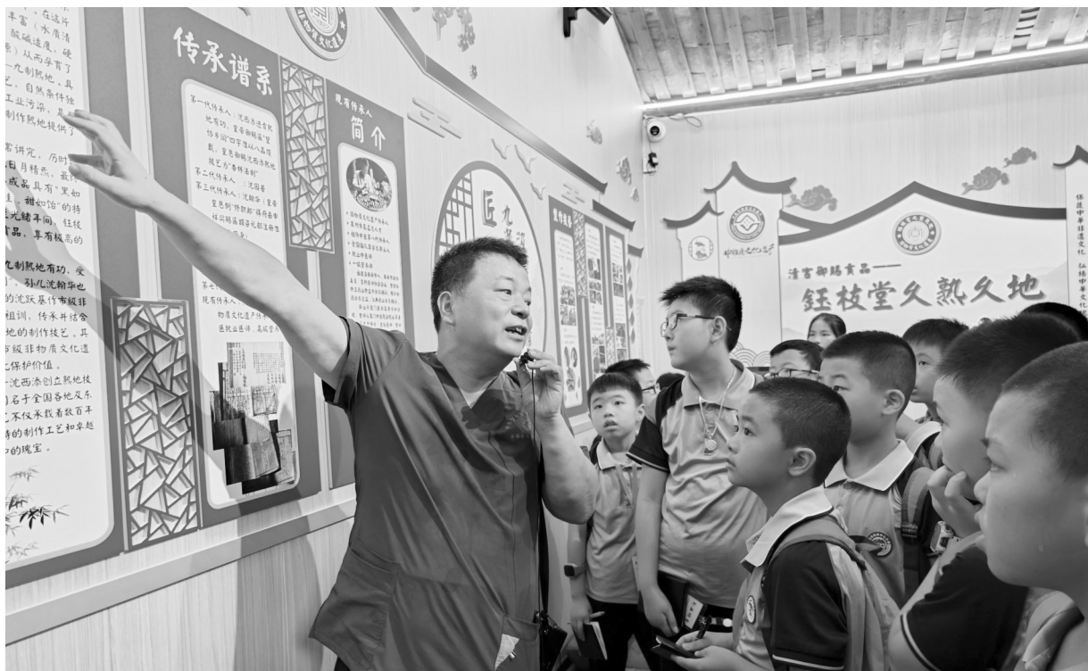
了解熟地制作工艺