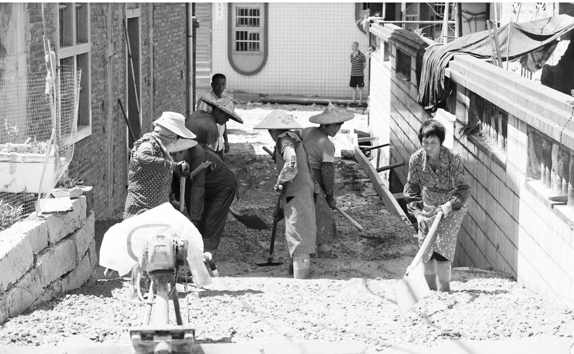
工人们在热火朝天地铺设水泥路面。

本报讯（记者 王丽清 黄奕群 通讯员 尤俊明 文/图）连日来，南安市溪美街道崎峰社区凤美路拓宽改造工程正在紧张铺设中。这段村路铺设完成后，崎峰社区乡村交通“毛细血管”将全部打通，实现全村道路硬化全覆盖。