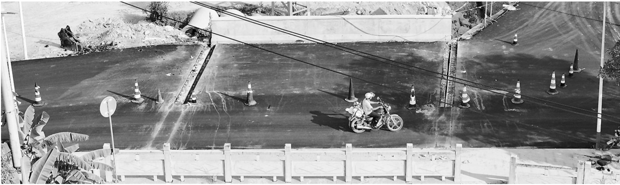
九都前桥主体工程已完成。

行功能的全面提升。两座桥均采用更稳固的单跨双桥墩设计，桥墩经过加固处理，桥面材料同步更新，显著提升承重能力与耐久性。