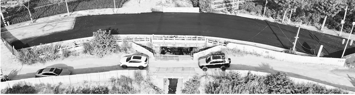
九都桥处于养护收尾阶段。