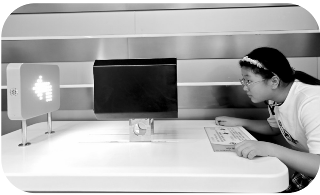
沉浸式体验科技魅力

每一处展示都让我应接不暇,我不禁为科技的神奇魅力而惊叹。自由活动时间,我迫不及待地体验了月球漫步。当我踩上模拟月面的踏板,双腿好似灌了铅般沉重,又仿佛失去了根基,刚想迈出一步,身体却不由自主地向旁边倾斜。我手忙脚乱地抓住扶手,额头差点就撞上了舱壁。这时,一旁的志愿者笑着解释:“月球引力小,走快了就会飘起来。”那一刻,我才真切地体会到宇航员在月球漫步时面临的困难。