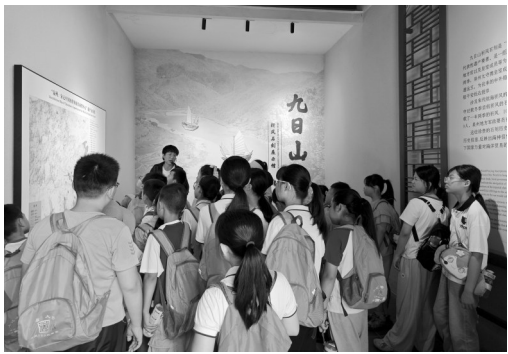
了解九日山的历史