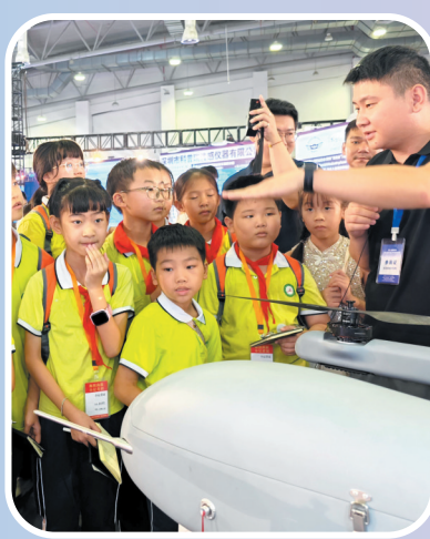
介绍无人机的作用