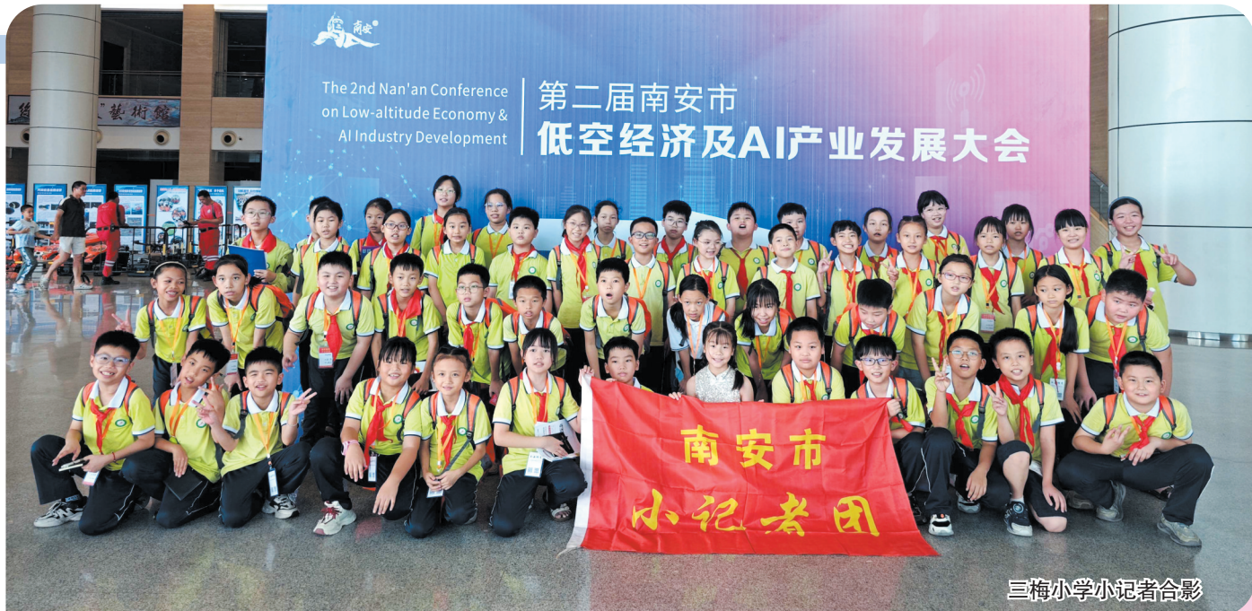
三梅小学小记者合影

返程的路上,我仍沉浸在科技所带来的震撼中。在这个日新月异的时代,我们享受着平安快乐的生活,让我不禁想起新闻里那些渴望和平的孩子们。此刻我深深体会到,所有的岁月静好,都是无数像科研工作这样默默无闻的人在为我们负重前行。