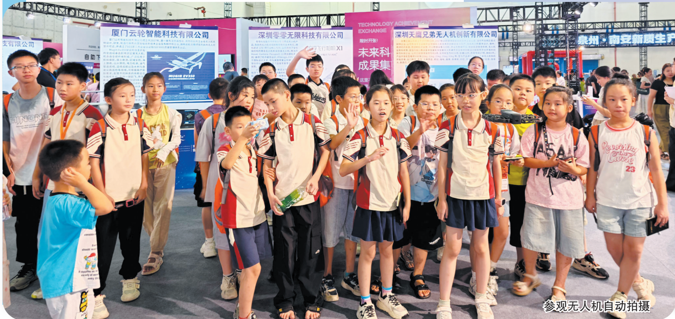
参观无人机自动拍摄