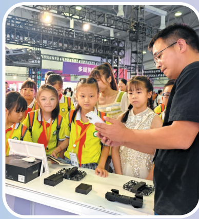
“哇,能语音操控的自动飞行器!”