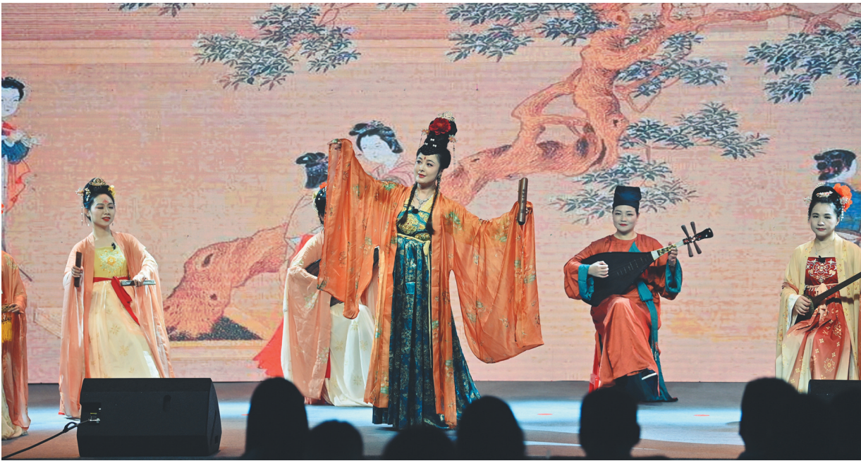
福建省百姓大舞台(南安地区)文艺演出现场

此外,南安还将通过评选思政工作优秀案例和思政课精品课程、制作思政课专题片、参观工作成果展、思政德育类实践展示等形式,举办南安市基层思想政治工作推进会暨“品味成功”大思政课专题展示活动,着力提升南安市大思政课工作的质量和水平。