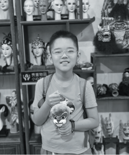
▲与自己喜欢的木偶头合影

到达目的地后,我们首先看到了一排排高大挺拔的樟树,它们树干粗壮,树皮有着独特的纹理,像是岁月