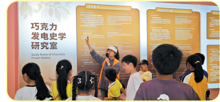
聆听巧克力知识讲解

推开OCOCO巧克力梦幻小镇的大门,一股浓郁的甜香立刻将我们包裹。我和伙伴们满心欢喜,迫不及待地开启了这场令人垂涎的美食探秘之旅。 工作人员先带我们来到“巧克力课堂”。房间里,大屏幕上正播放着可可豆