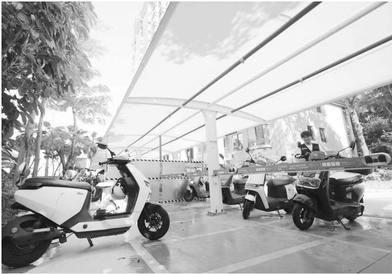
车棚安装了两排红色喷淋管道，平均每隔2米就有1个垂直向下的喷头。

记者了解到，这套喷淋系统名为“水喷雾灭火系统”。监测火焰的摄像头平时可用于安防，能提供实时影像记录。一旦探测到火情，信息将立即反馈到智能系统，系统会自动启动灭火装置，保护区域内所有水雾喷头同时喷洒，通过冷却、窒息、冲击和覆盖等多重作用高效灭火。同时，系统会实时将火情传输至监控室或消防控制室，提醒值班人员启动应急预案，并通知附近安保人员迅速赶赴现场疏散人员、控制火势。