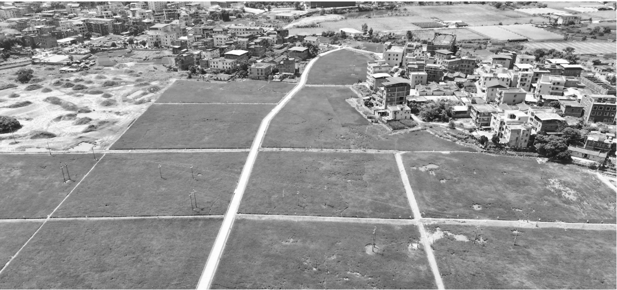
柳城180亩核心区水稻长势良好,预计7月下旬至8月上旬迎来大丰收。

据了解,该项目由莆田市政府牵头引进社会资本方,农业农村局与自然资源局主管,能源工贸投资发展集团与国机集团下属央企中国联合工程有限公司共同投资建设。同时,中国联合工程有限公司作为农业运营主体前置参与项目设计实施,通过“规划-实施-运营”全链条整合,打破传统农田建设模式局限,有效破解大量乡村振兴项目中建设运营脱节的痛点问题。在原高标准农田建设基础上,运营主体系统性考虑周边零散耕地、补充耕地、早改水、林耕置换等农用地连片整治,实现整个农田生态系统修复,同步以农事服务中心建设带动农业基础设施一体化提升。