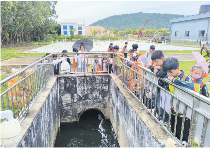
实地参观污水由浑浊到清澈的全过程

污水处理厂是如何对这些污水进行处理的呢?在参观过程中,我了解到污水进入处理后,首先会经过粗格栅这一关卡。粗格栅宛如一个巨大的筛子,能够拦截住污水中的大型垃圾,紧接着,污水会流