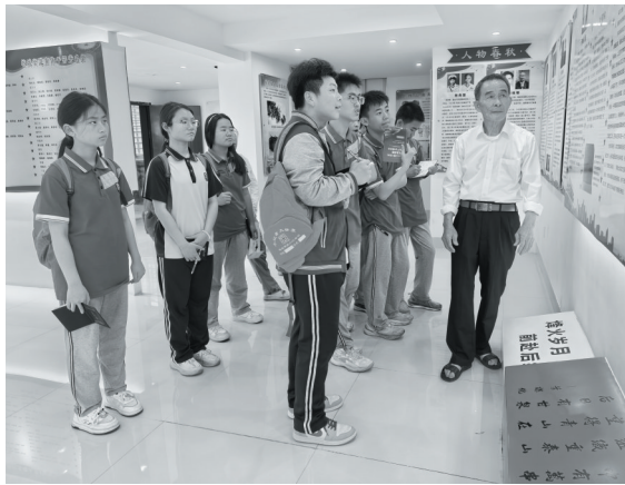
认真聆听革命故事

近日,南安一中的小记者前往柳城革命老区红色文化教育基地,通过图画、文献和实物,了解革命先烈的英勇事迹,重温革命历史,传承红色基因。