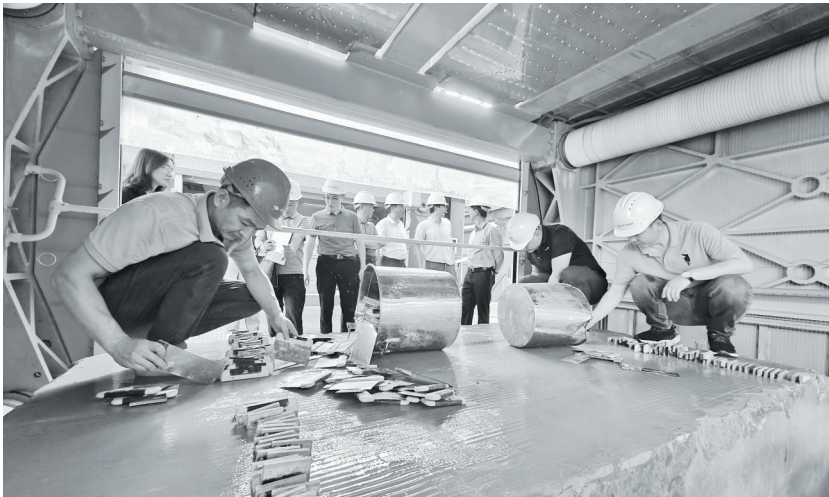
评审组深入各厂区车间,实地考评线锯设备。

“毕业季来临,我们将继续加强与高校、企业的合作,举办多场毕业季校园引才推介活动,吸引更多青年才俊来南安发展。”市人社局相关负责人表示,接下来,将加大对毕业生的就业指导和服务力度,帮助他们更好地适应市场需求,实现个人价值和社会价值的双重提升。