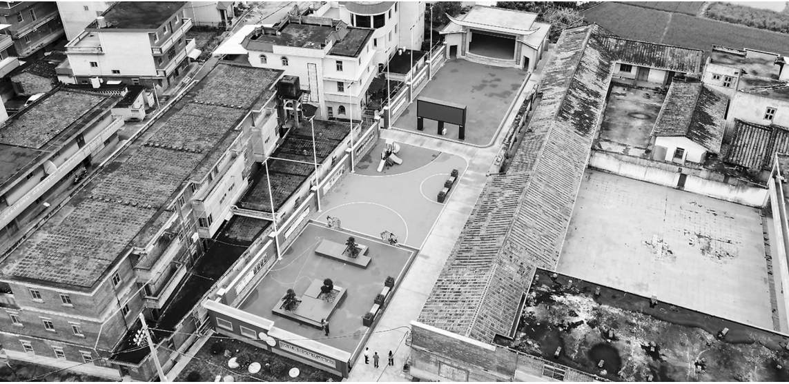
位于码头镇大庭村的侨贤文化活动中心