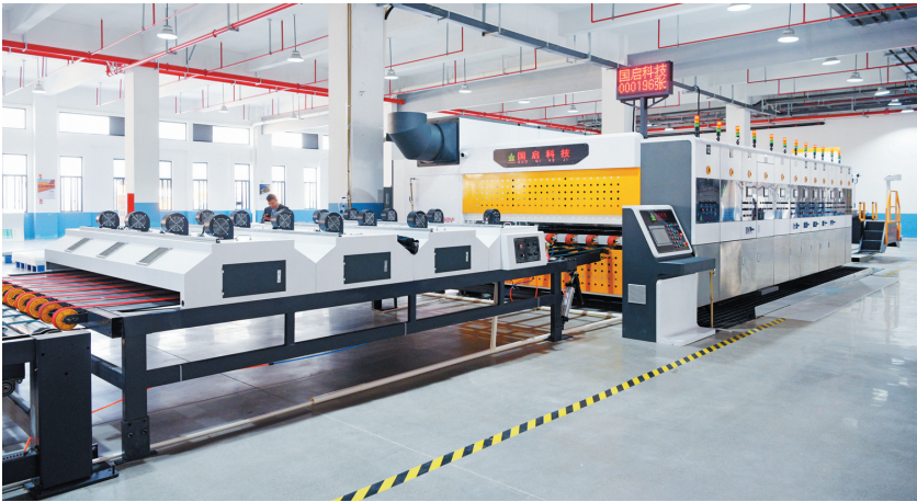
福建国启新材料有限公司从签约到投产仅用时 5 个月。图为该公司新材料生产线。

组的努力动员和企业主的支持配合下,南安五中迁建项目的首宗厂房顺利拆除,成功敲下了征迁“第一锤”。