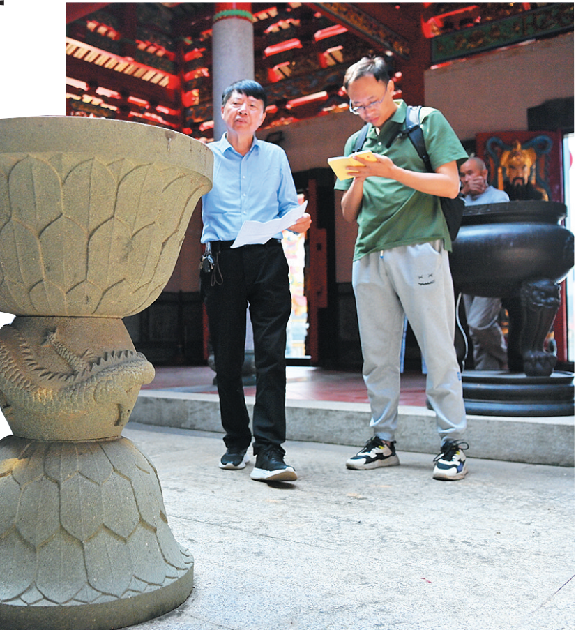
蓬华镇华美村新发现的施食台

台,其提供了供养人、年代、功能的关键历史信息,是研究元代闽南宗教信仰的实物见证。”南安市博物馆馆长曾