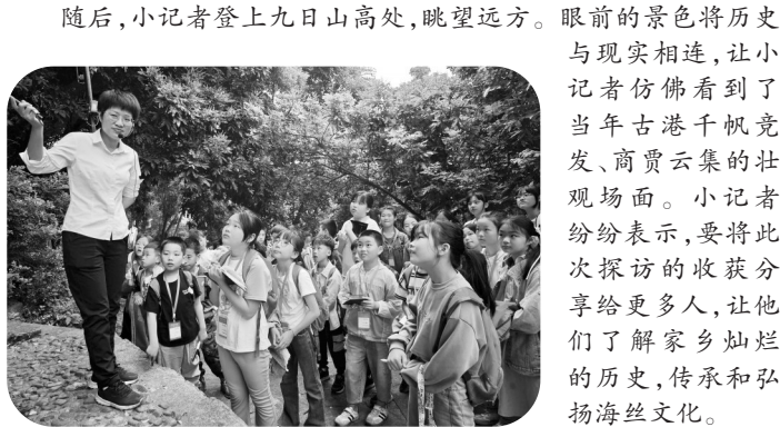
小记者认真听讲解。

在讲解员的带领下,小记者踏入九日山。在摩崖石刻前,讲解员详细介绍:“这些石刻记载着宋代祈风等重要史实,见证了古泉州港的繁荣,是海上丝绸之路的珍贵历史见证。”小记者认真聆听,不时记录。