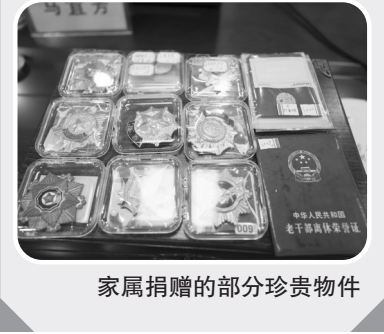
家属捐赠的部分珍贵物件

身经百战赤胆忠心 南安有位“一等人民功臣” 马天明是南安洪瀨人,1925年出生于一个贫苦的农民家庭,青年时代还被国民党抓去当壮丁,受尽欺凌。 1945年,马天明在浙江参加新四军,先后担任新四军第一纵队(苏浙军区)战士、爆炸班长。由于战斗勇敢、赤胆忠心,1946年他便加入中国共产党。在他的军旅生涯中,经历过抗日战争、解放战争和抗美援朝战争,参加