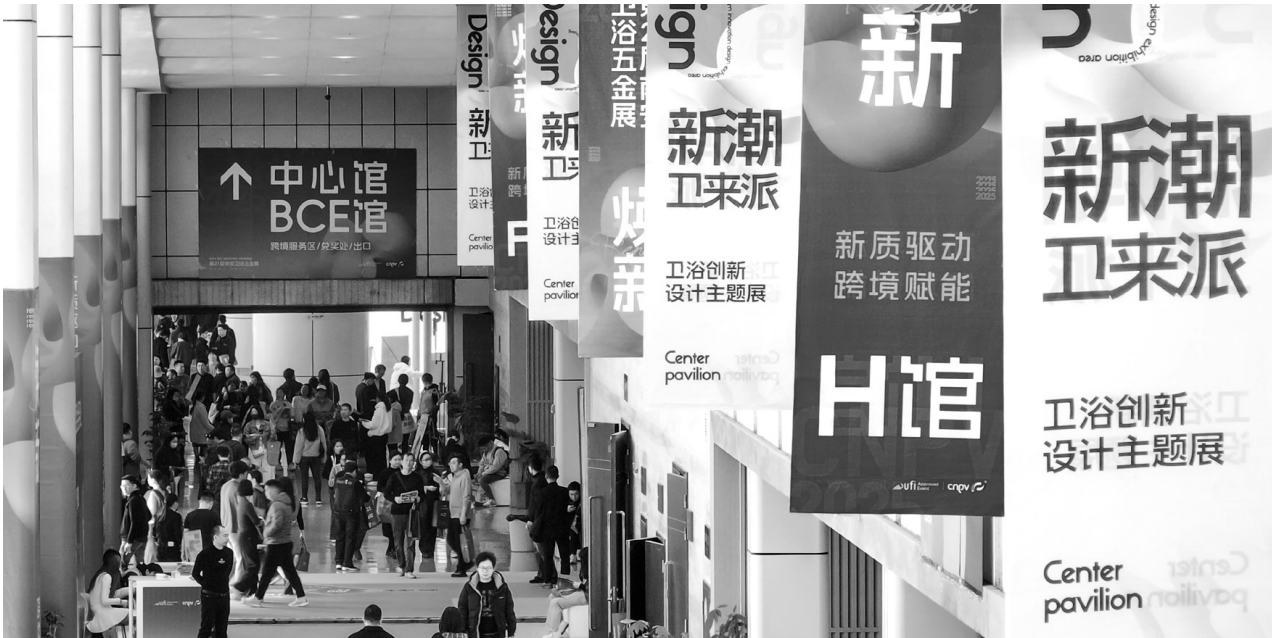
展会现场,人流如织。