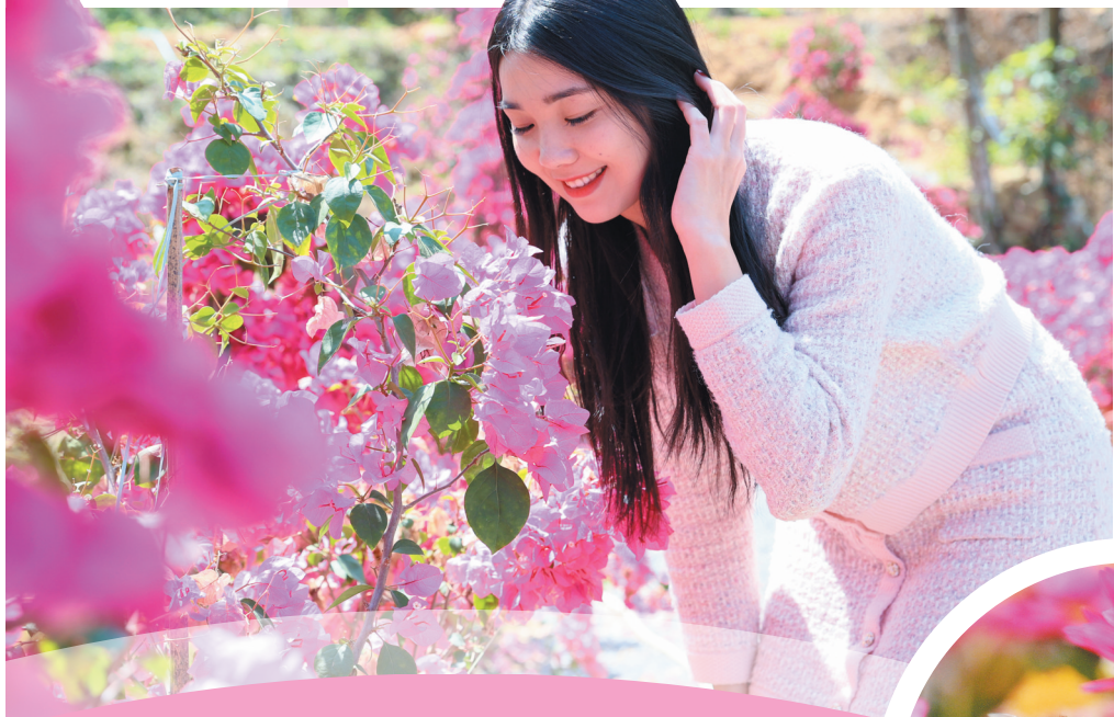
▼盛开的三角梅,是大自然最绚烂的笔触,绘就一幅生机勃勃的画卷。拍摄于英都镇