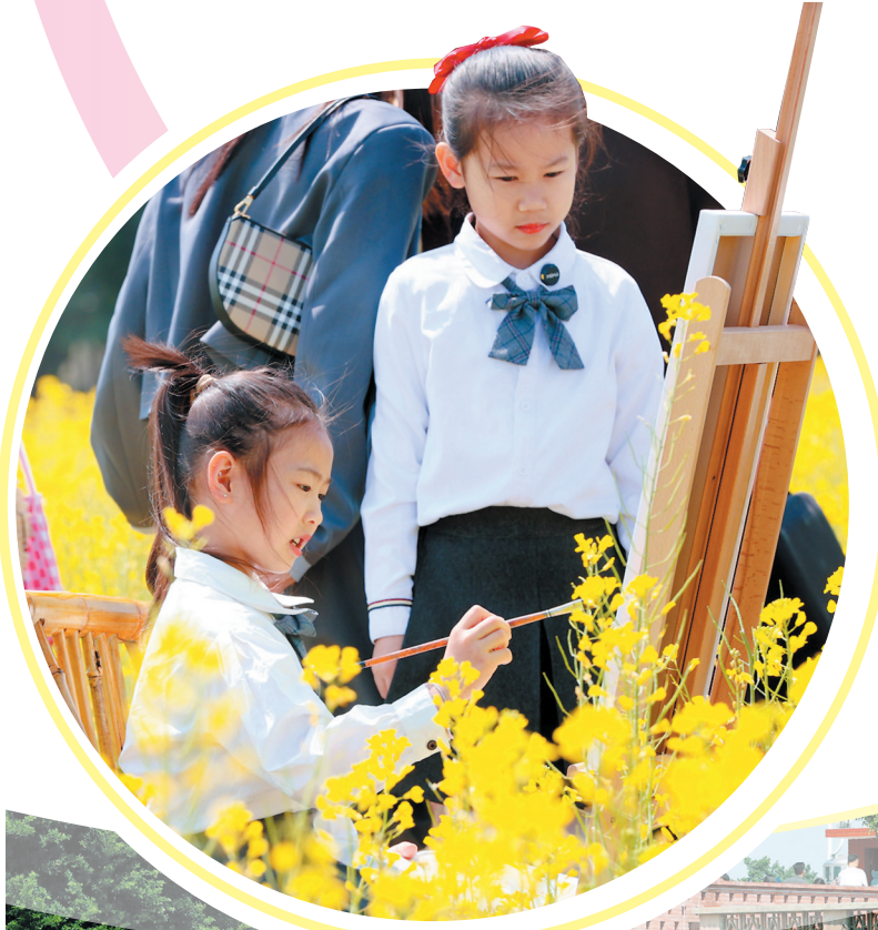
▲油菜花里“画春天”。拍摄于水头五里大盈溪