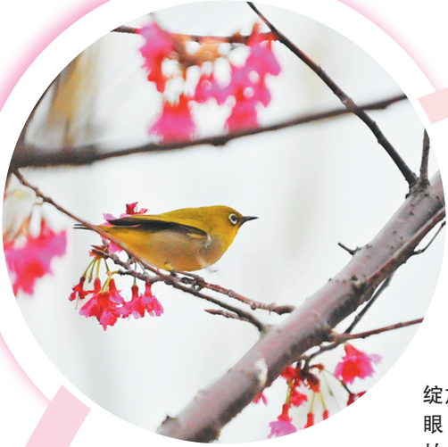
▲樱花绽放,引来绣眼鸟驻留。拍摄于武荣公园