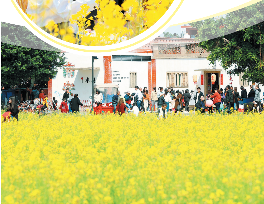
丰州清境桃源 ▲春日的暖风,吹开了一树烂漫的樱花,惹来市民拍照留念。拍摄于 连,放松身心、亲近自然。拍摄于水头五里大盈溪 ▲趁着晴好天气,不少游客来到户外踏青赏景,在油菜花田中徜徉流