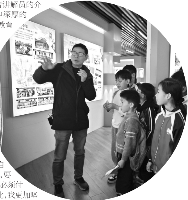
聆听南安一中校史

在一个阳光明媚的春日,我们小记者怀揣着期待,前往有着近百年历史的南安一中,开启了一场意义非凡