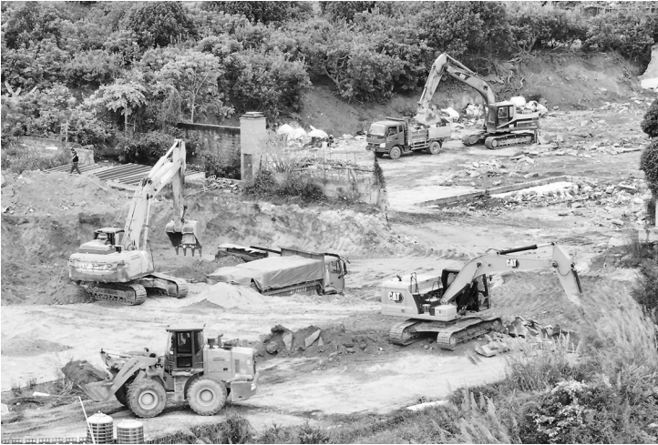
南安五中新校用地现场

程中，获得了不少企业和群众的支持，位于省新镇的泉州安磁电子有限公司就是其中一家。