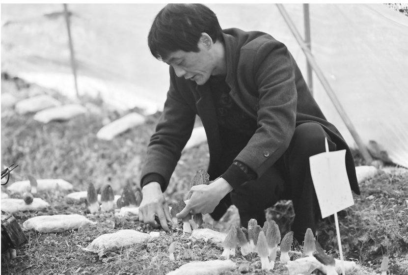
羊肚菌已经陆续开始采收。

尝到甜头后，卓厝村集体便引入了南安市莹丽辰农业综合开发专业合作社，盘活了30多亩流转土地，构建“合作社+村集体+农户”的三方共赢机