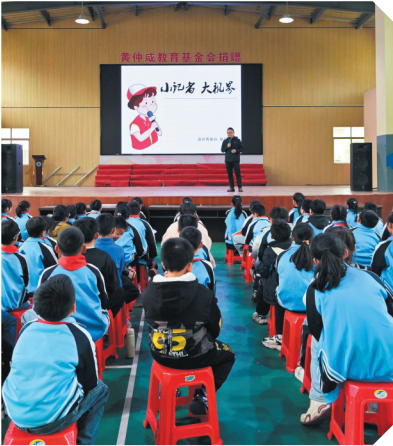
小记者第一堂课开课啦!