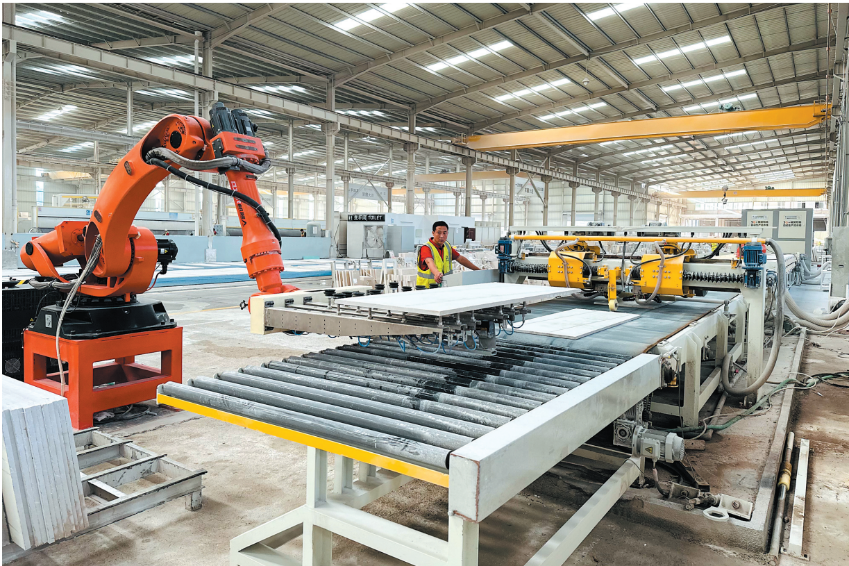
近年来，南安石材企业苦练内功，紧跟智能化、数字化趋势，一批批石材新装备和新技术应声落地。

采购到销售的价值链，这种“授人以渔”的策略使英良集团外贸出口额在2024年实现翻番。