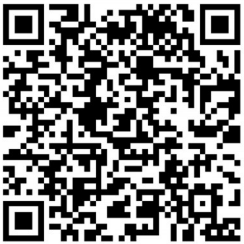
查看相关名单。 扫描二维码。

南安市园区置业发展有限公司；纳税超5000万元的企业3家，分别为福建宏图华昌物流港有限公司、国网福建省电力有限公司南安市供电公司、福建三叶集团有限公司。 此外，纳税超3000万元的企业12家，纳税超2000万元的企业20家，纳税超1000万元的企业44家。