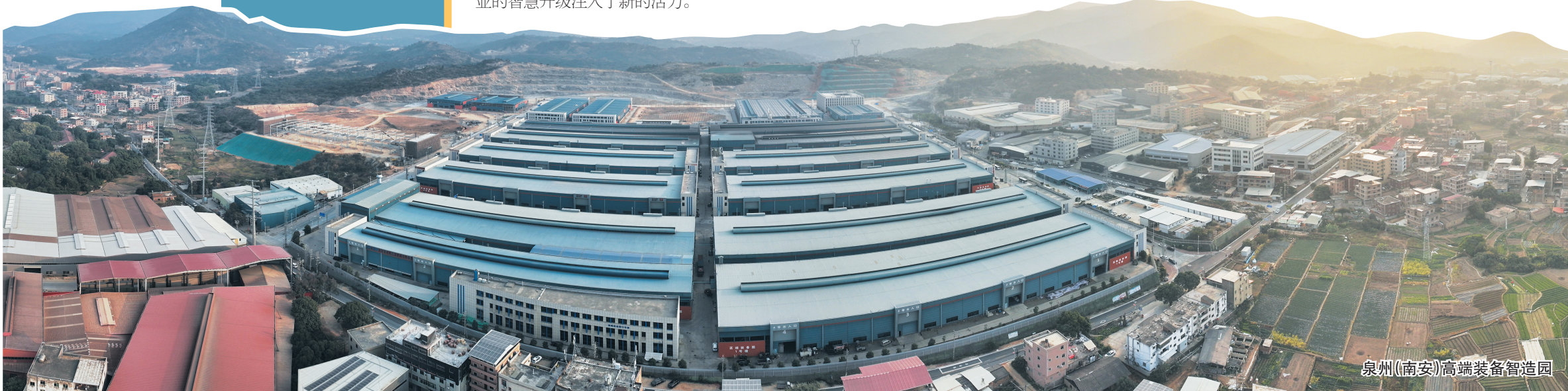
泉州(南安)高端装备智造园

参展的会员企业纷纷纷纷表示,这次盛会不仅是他们展示最新科技成果与行业创新的舞台,更是深化合作、共谋发展的重要契机。展区内,各家企业精心布置的展位上,从智能化的高端机械到环保节能的新型设备,无不彰显着行业发展的蓬勃活力与未来趋势。“展会期间,来自全球的外商客户与我会参展单位洽谈签约,并签署了大量的意向订单,收获满满。”南安市装备制造业协会相关负责人说。