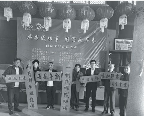
南安书法家展示作品。

本报讯(记者 傅雅兰 通讯员 林应权 文/图)挥毫送春联,墨香添年味。15日,石井郑成功祖庙、台南郑成功庙一片热闹欢腾。两地同步举行“共书成功事,同写两岸春”主题活动写春联活动,并以视频连线方式互动交流。